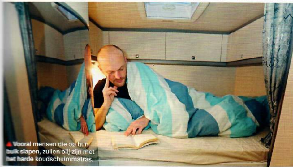
▲ Vooral mensen die op hun buik slapen, zullen blij zijn met het harde koudschuimmatras.

Over bergruimte gesproken, daarvan heeft hij genoeg, we zijn van Hobby niet anders gewend