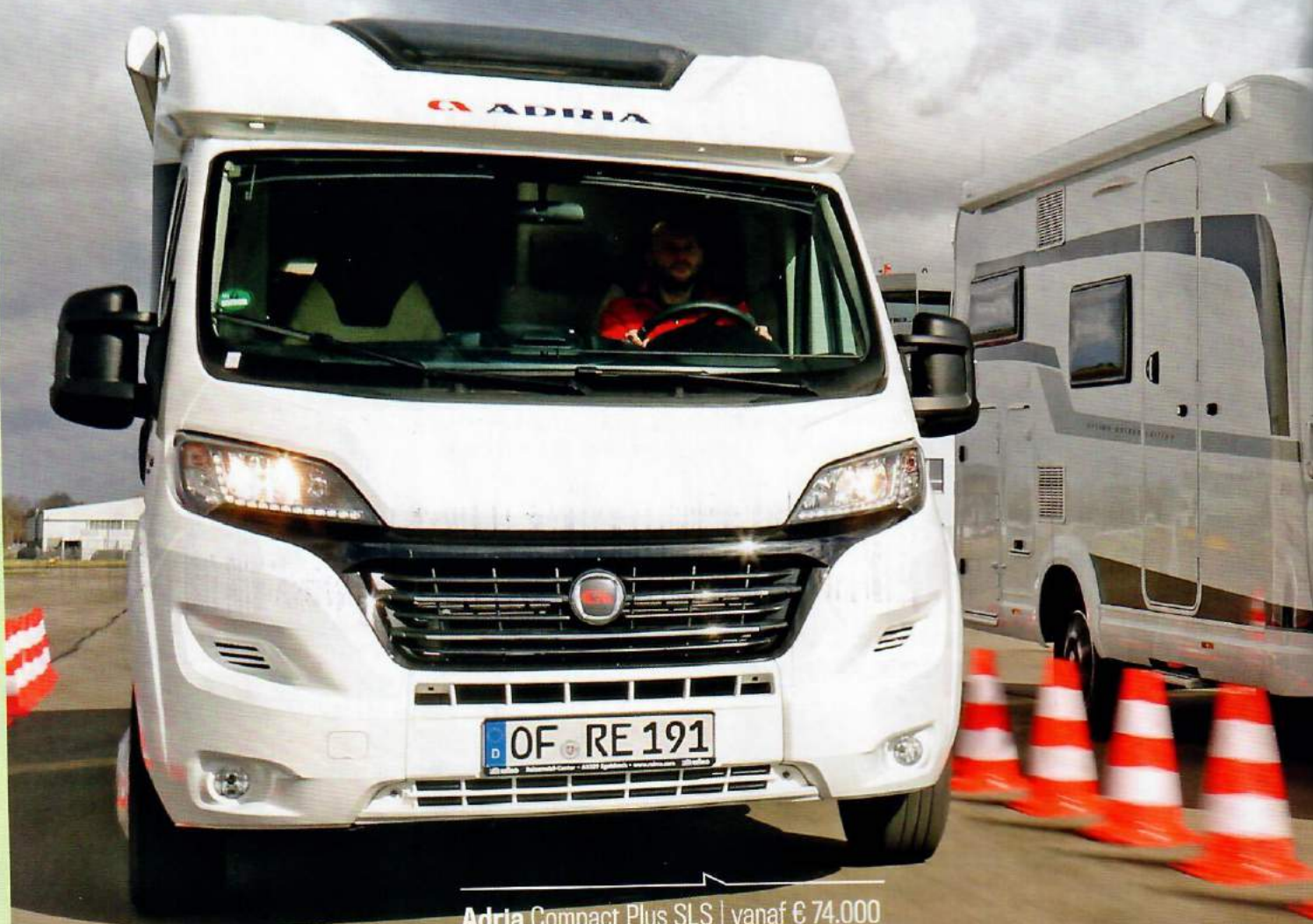
Adria Compact Plus SLS | vanaf € 74.000

📄 Albert-Jan Cornelissen