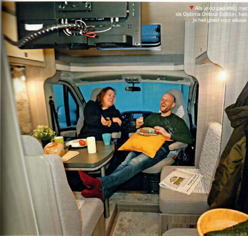
▼ Als je op pad mag met de Optima Ontour Edition, heb je het goed voor elkaar.