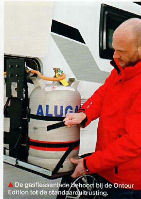
▲ De gasflessenlade behoort bij de Ontour Edition tot de standaarduitrusting.

Over bergruimte gesproken, daarvan heeft hij genoeg, we zijn van Hobby niet anders gewend