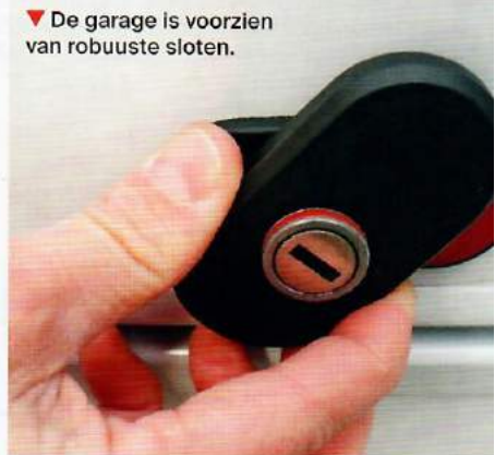
▼ De garage is voorzien van robuuste sloten.