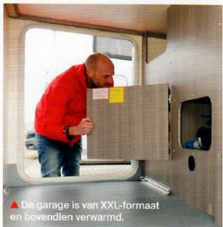
▲ De garage is van XXL-formaat en bovendien verwarmd.